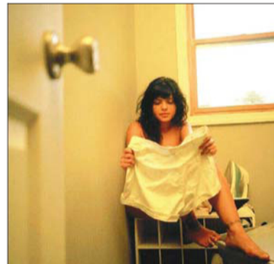
Dos de las reveladoras obras de Coco Martín.

“Se podría decir que yo buscaba la obtención al azar de muestras visuales que me permitían enlazar me con los habitantes de esas ciudades y hacerlas más ‘do-